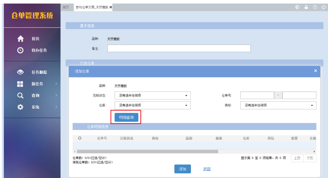
仓单管理系统-新任务-仓单交易-参与仓单交易-选择品种: