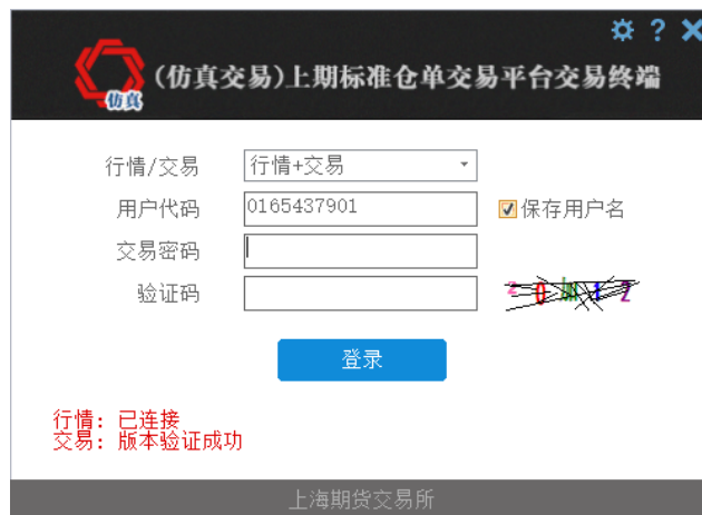
图 1.仿真交易软件登录界面

仿真交易使用单独的软件，需要联系大宗商品部获取并安装，软件的登录页面和主界面都有明显的仿真交易提示（如下图）。注意不要与真实交易的软件混淆。